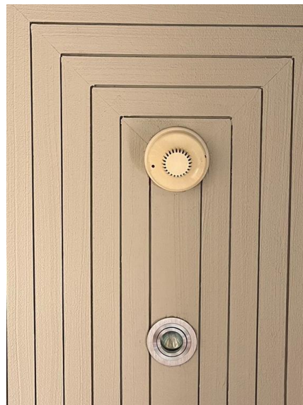
อุปกรณ์ตรวจจับควัน