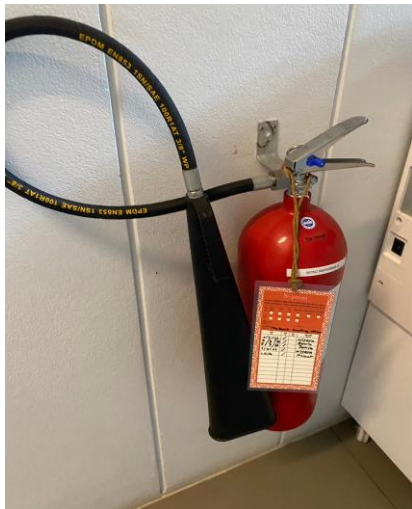
ถังดับเพลิง