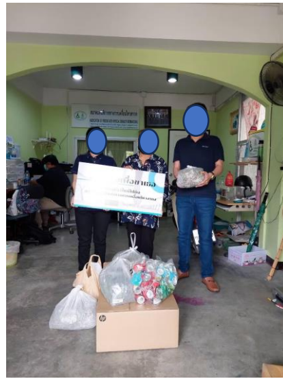
รูปภาพที่ 2.3 การร่วมกิจกรรมกับชุมชน