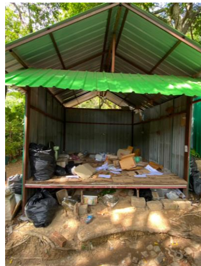
รูปภาพที่ 2.45 โรงคัดแยกขยะ