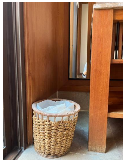
รูปภาพที่ 2.48 ถังขยะมูลฝอยในพื้นที่ต่างๆ ของโรงแรม