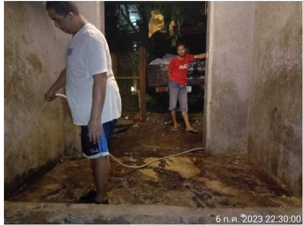
รูปภาพที่ 2.23 การทำความสะอาดห้องพักรวมและถังขยะ