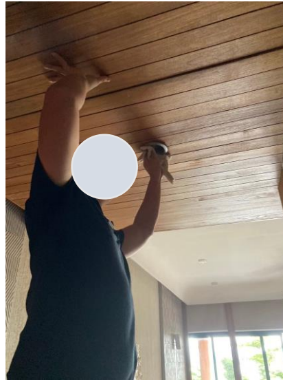
รูปภาพที่ 2.26 การซ่อมบำรุงอุปกรณ์ระบบไฟฟ้าส่วนกลาง