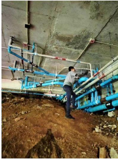
รูปภาพที่ 2.40 การตรวจเช็คเส้นท่อน้ำใช้/ระบบการจ่ายน้ำ