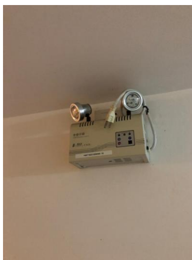
ไฟฉุกเฉิน