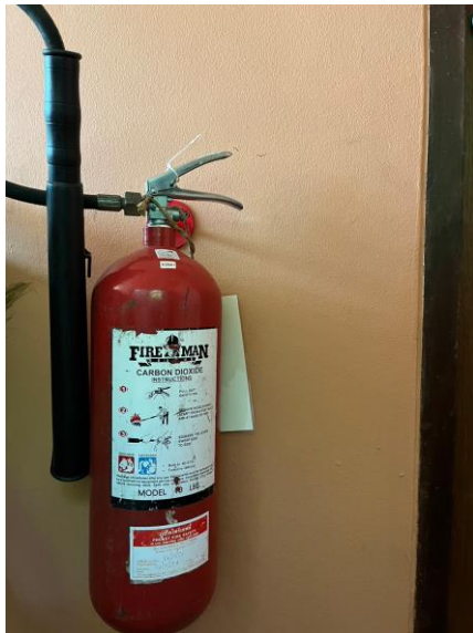
ถังดับเพลิง