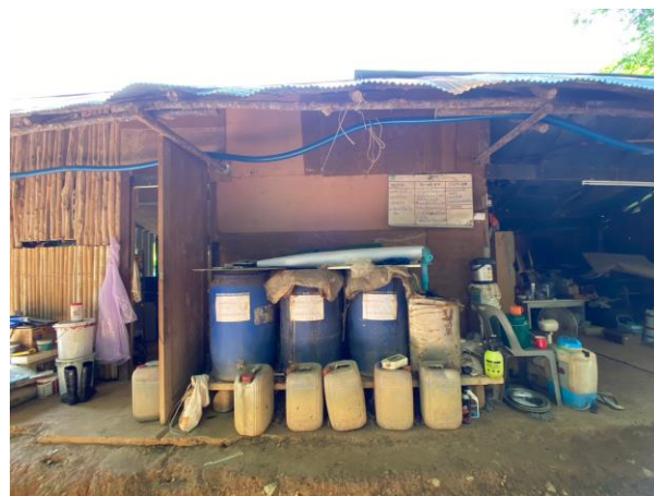
รูปภาพที่ 2.20 จุดทำปฏิกิริยาหมักชีวภาพของโรงแรม