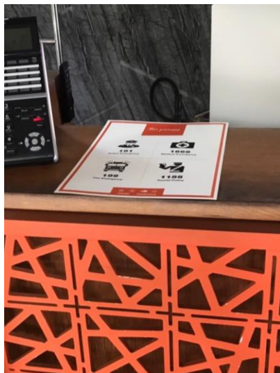
รูปภาพที่ 2.19 เบอร์โทรฉุกเฉิน