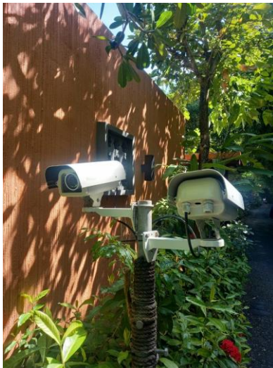
รูปภาพที่ 2.12 ระบบโทรทัศน์วงจรปิด (CCTV)