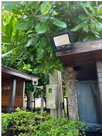
รูปภาพที่ 2.36 ไฟฟ้าส่องสว่างทางเข้า-ออกโครงการ