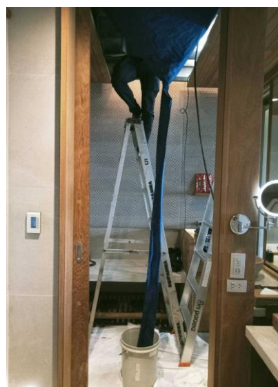
รูปภาพที่ 2.2 การทำความสะอาดเครื่องปรับอากาศ