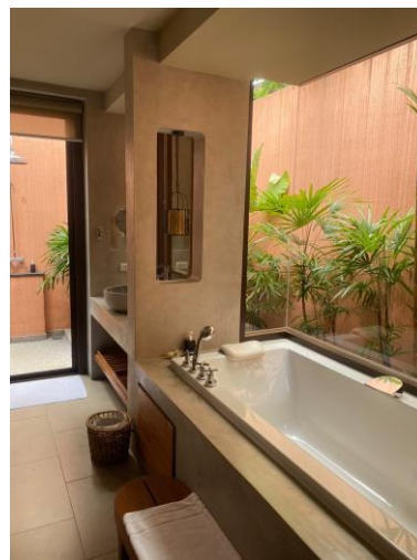
รูปภาพที่ 2.11 สุขภัณฑ์ที่ประหยัดน้ำ