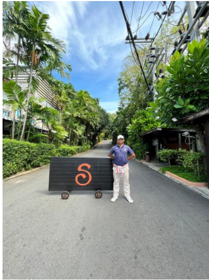
รูปภาพที่ 2.31 เจ้าหน้าที่รักษาความปลอดภัย