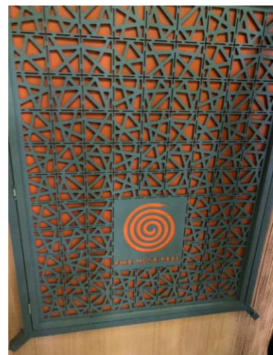
สายฉีดน้ำดับเพลิง