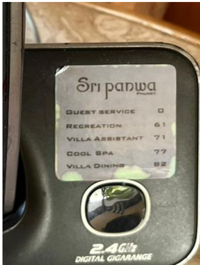
รูปภาพที่ 2.49 เบอร์โทรฉุกเฉิน