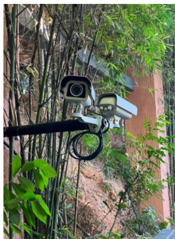
รูปภาพที่ 2.39 ระบบโทรทัศน์วงจรปิด (CCTV)