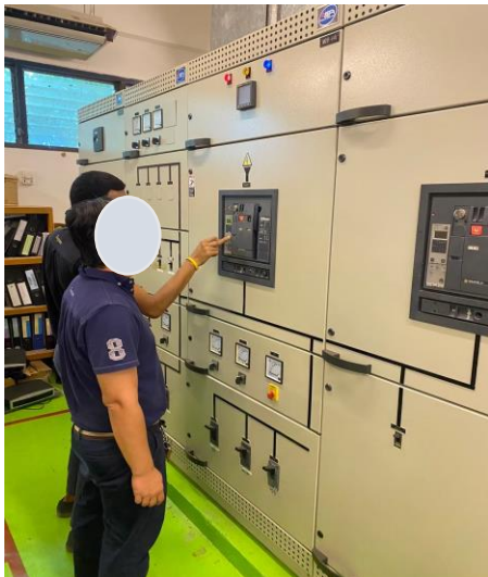
รูปภาพที่ 2.51 Circuit Breaker ของโรงแรม