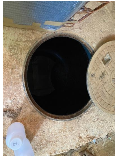
รูปภาพที่ 2.42 ระบบบำบัดน้ำเสีย