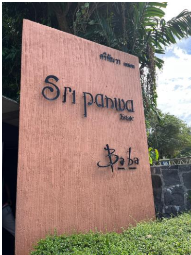
รูปภาพที่ 2.32 ป้ายโครงการ