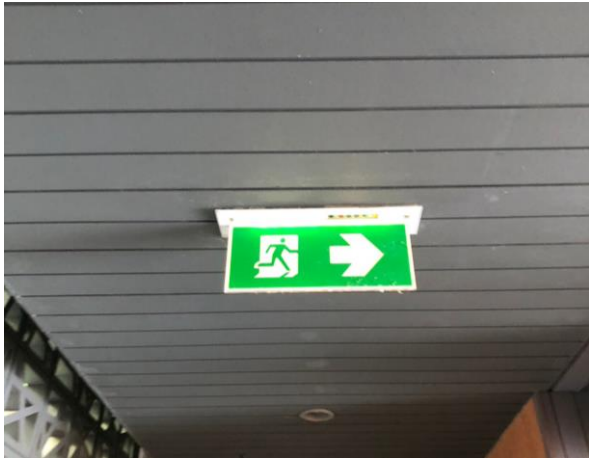
รูปภาพที่ 2.22 ป้ายทางหนีไฟ