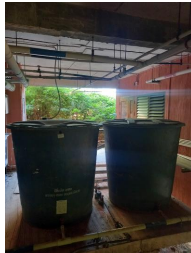
รูปภาพที่ 2.37 ถังเก็บน้ำใช้