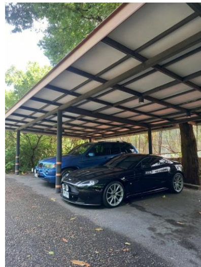
รูปภาพที่ 2.6 ลานจอดรถ