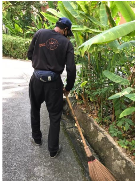
รูปภาพที่ 2.16 รางระบายน้ำและการทำความสะอาด