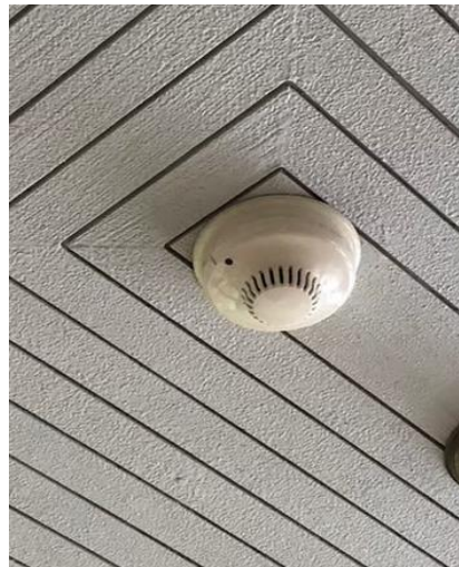
อุปกรณ์ตรวจจับควัน