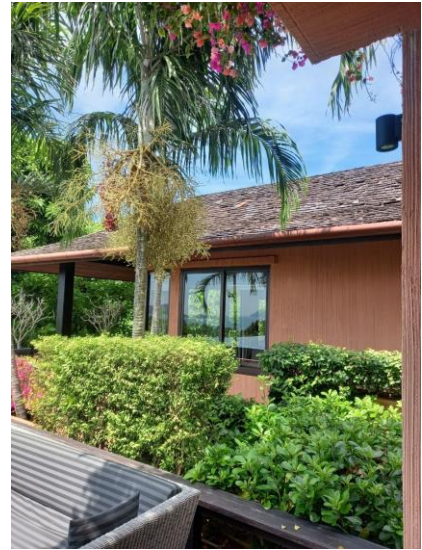
รูปภาพที่ 2.28 พื้นที่สีเขียว