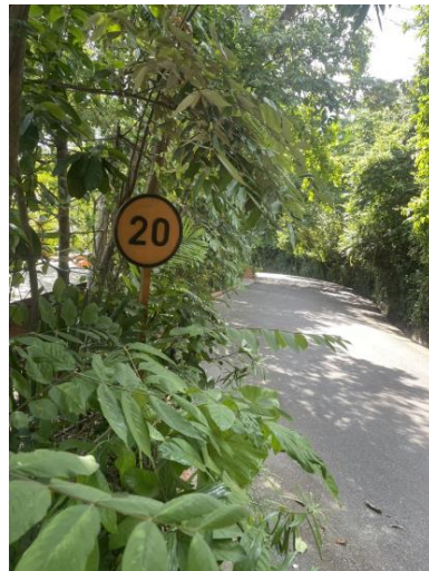
รูปภาพที่ 2.8 ป้ายจำกัดความเร็ว 20 กม./ชม.