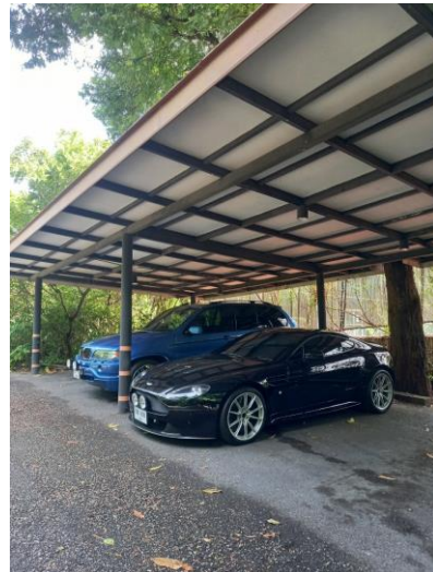
รูปภาพที่ 2.33 ลานจอดรถ