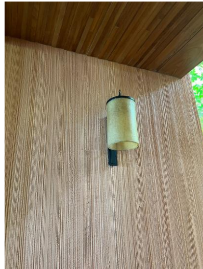
รูปภาพที่ 2.53 อุปกรณ์ไฟฟ้าส่องสว่างแบบประหยัดพลังงาน