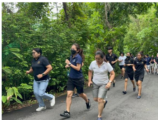
รูปภาพที่ 2.54 การซ้อมอพยพหนีไฟ