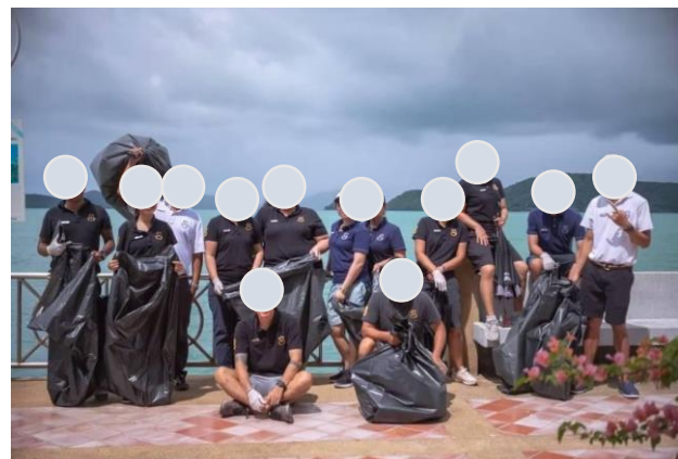
รูปภาพที่ 2.30 การร่วมกิจกรรมกับชุมชน