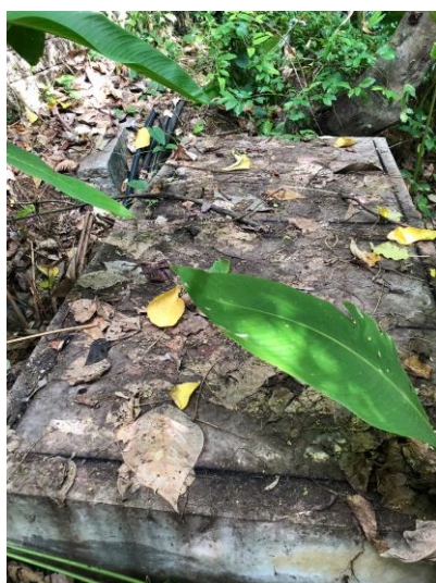
รูปภาพที่ 2.14 บ่อหน่วงน้ำและบ่อพักน้ำ