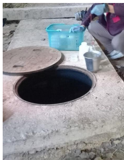
รูปภาพที่ 2.15 ระบบบำบัดน้ำเสีย