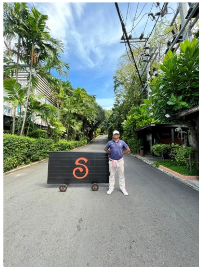
รูปภาพที่ 2.4 เจ้าหน้าที่รักษาความปลอดภัย