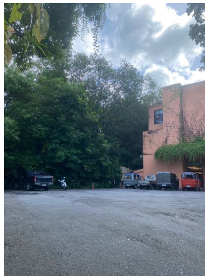
รูปภาพที่ 2.17 บริเวณพื้นที่จอดรถรวมพล