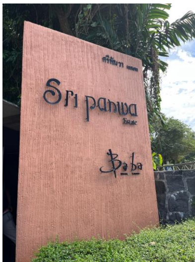
รูปภาพที่ 2.5 ป้ายโครงการ