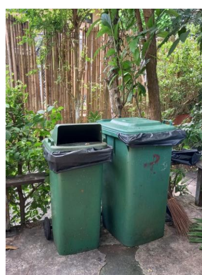
รูปภาพที่ 2.21 ถังขยะมูลฝอยในพื้นที่ต่างๆ ของโรงแรม