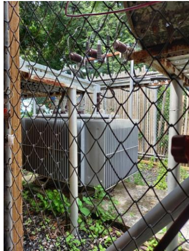
รูปภาพที่ 2.24 หม้อแปลงไฟฟ้า