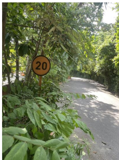
รูปภาพที่ 2.35 ป้ายจำกัดความเร็ว 20 กม./ชม.