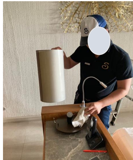
รูปภาพที่ 2.52 การซ่อมบำรุงอุปกรณ์ระบบไฟฟ้าส่วนกลาง