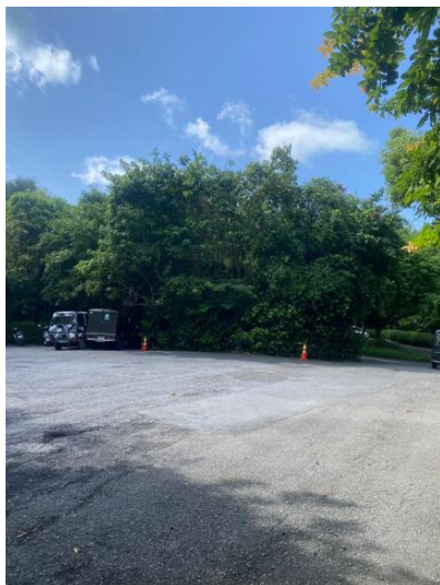
รูปภาพที่ 2.44 บริเวณพื้นที่จัดรวมพล