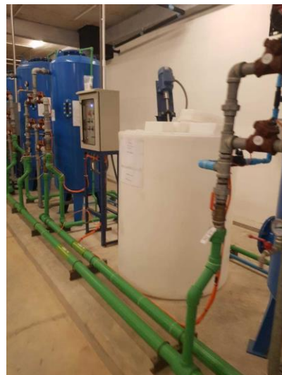
รูปภาพที่ 2.13 การตรวจเช็คเส้นท่อน้ำใช้/ระบบการจ่ายน้ำ