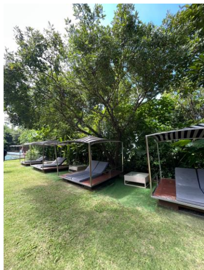
รูปภาพที่ 2.1 พื้นที่สีเขียว