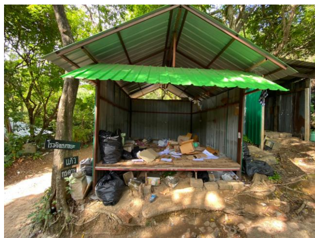
รูปภาพที่ 2.18 โรงคัดแยกขยะ