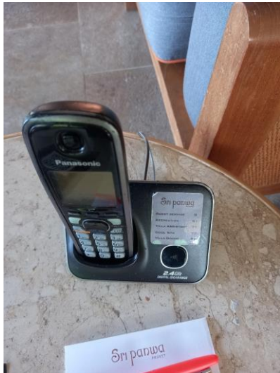
รูปภาพที่ 2.41 โทรศัพท์ติดต่อกภายในห้องพัก