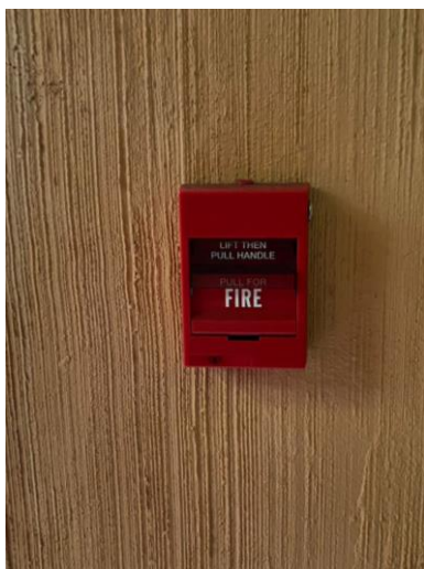
อุปกรณ์แจ้งเหตุด้วยมือ