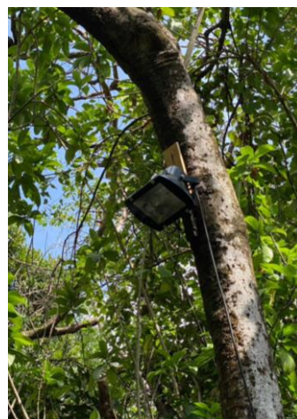
รูปภาพที่ 2.25 อุปกรณ์ไฟฟ้าส่องสว่างแบบประหยัดพลังงาน