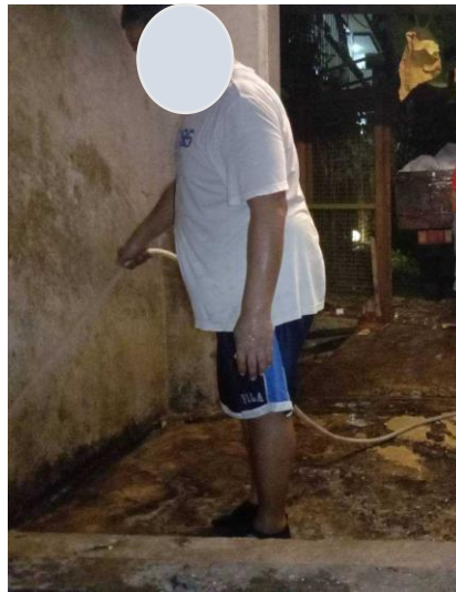
รูปภาพที่ 2.50 การทำความสะอาดห้องพักขยะรวมและถังขยะ