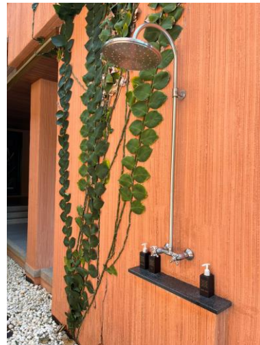
รูปภาพที่ 2.38 สุขภัณฑ์ที่ประหยัดน้ำ