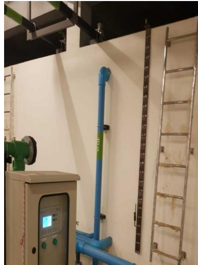
รูปภาพที่ 2.10 ถังเก็บน้ำใช้