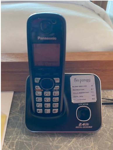
รูปภาพที่ 2.7 โทรศัพท์ติดต่อกภายในห้องพัก