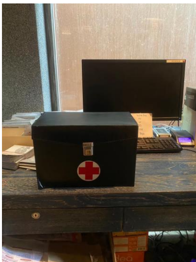
รูปภาพที่ 2.34 อุปกรณ์ปฐมพยาบาล